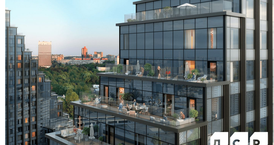
Жилой комплекс: Обручева 30 Год постройки: 2026