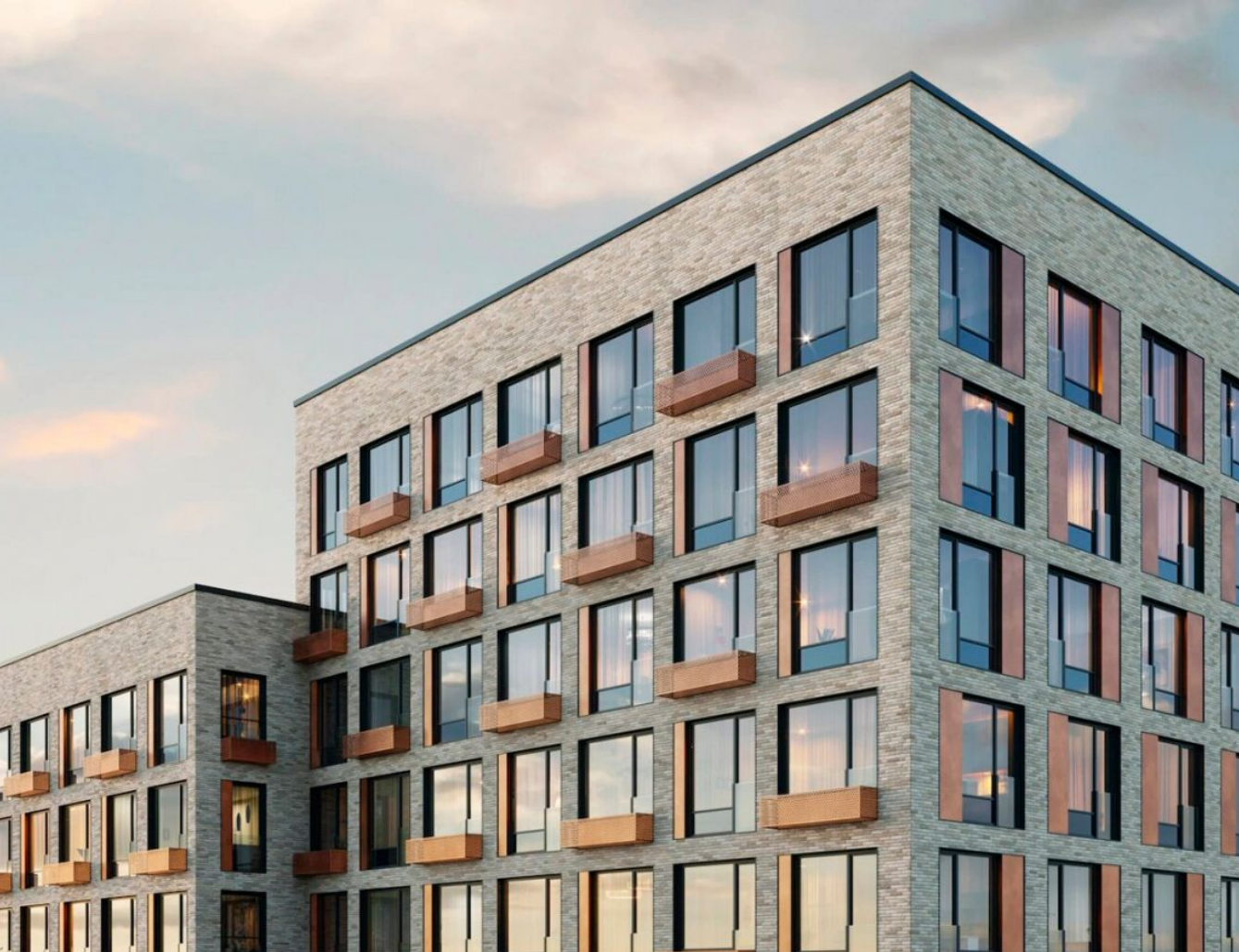
Жилой комплекс: Champine Год постройки: 2024