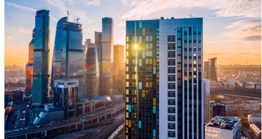
Корпус ЖК: Корпус 8 Квартал сдачи: 4