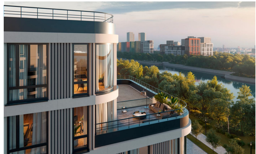
Корпус ЖК: Корпус 7.1 Квартал сдачи: 4