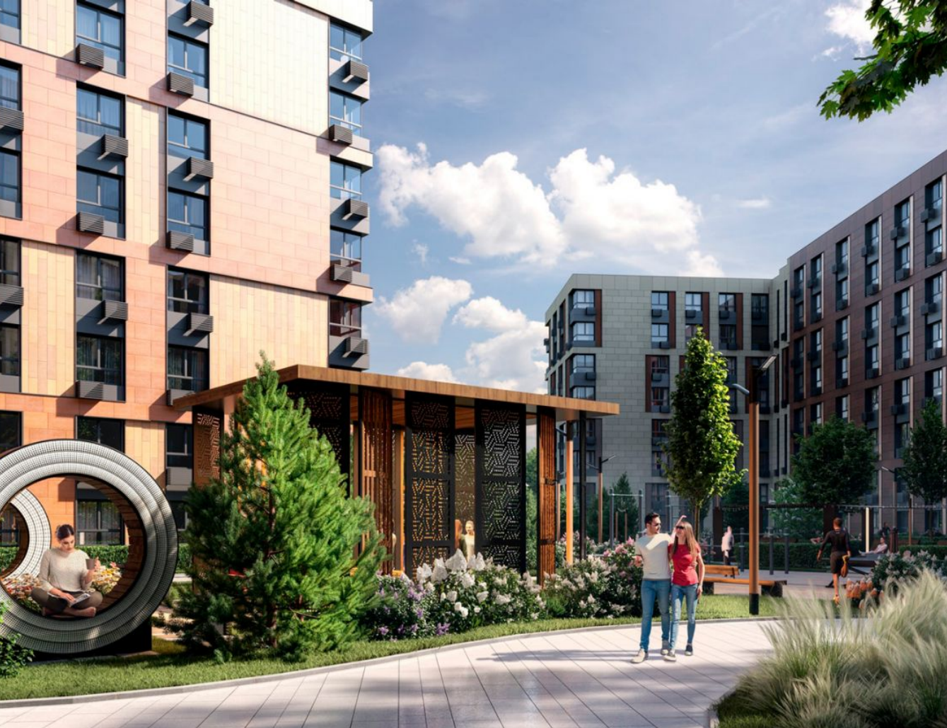
Жилой комплекс: Clementine Год постройки: 2024