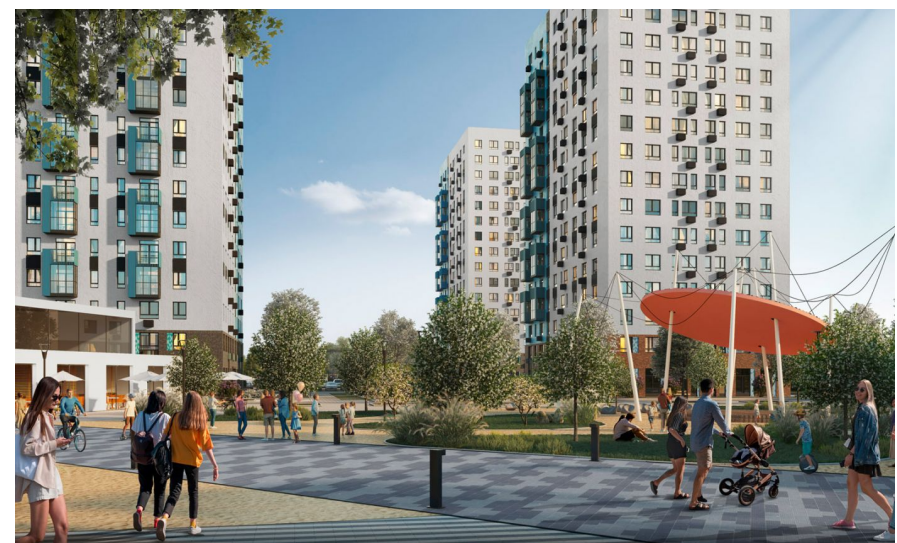
Корпус ЖК: Корпус 9.1 Квартал сдачи: 4