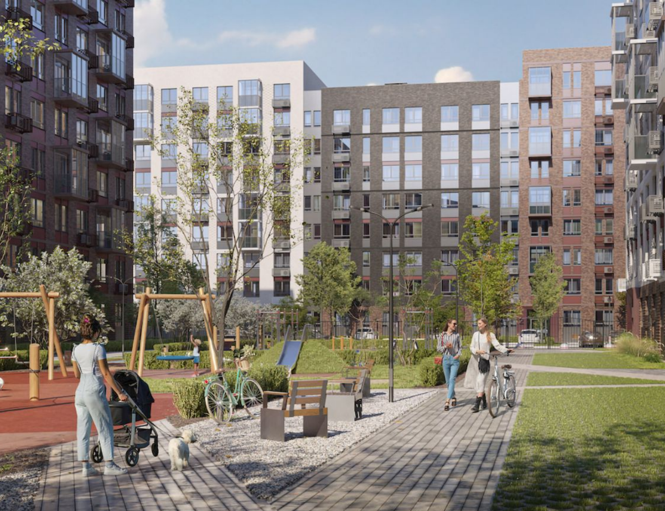
Жилой комплекс: Рублевский квартал Год постройки: 2024