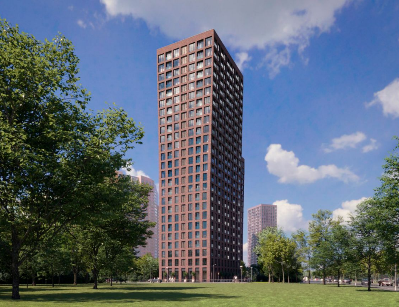
Жилой комплекс: AFI PARK Воронцовский Год постройки: 2024