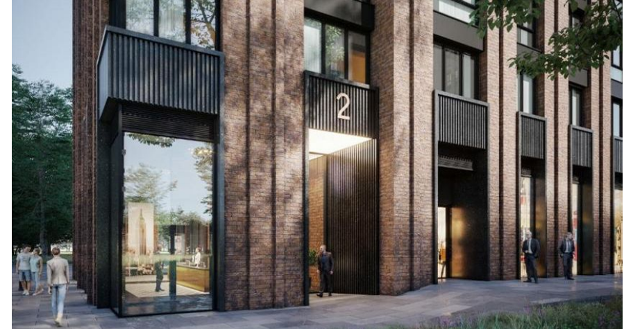
Корпус ЖК: Корпус 9 Квартал сдачи: 2