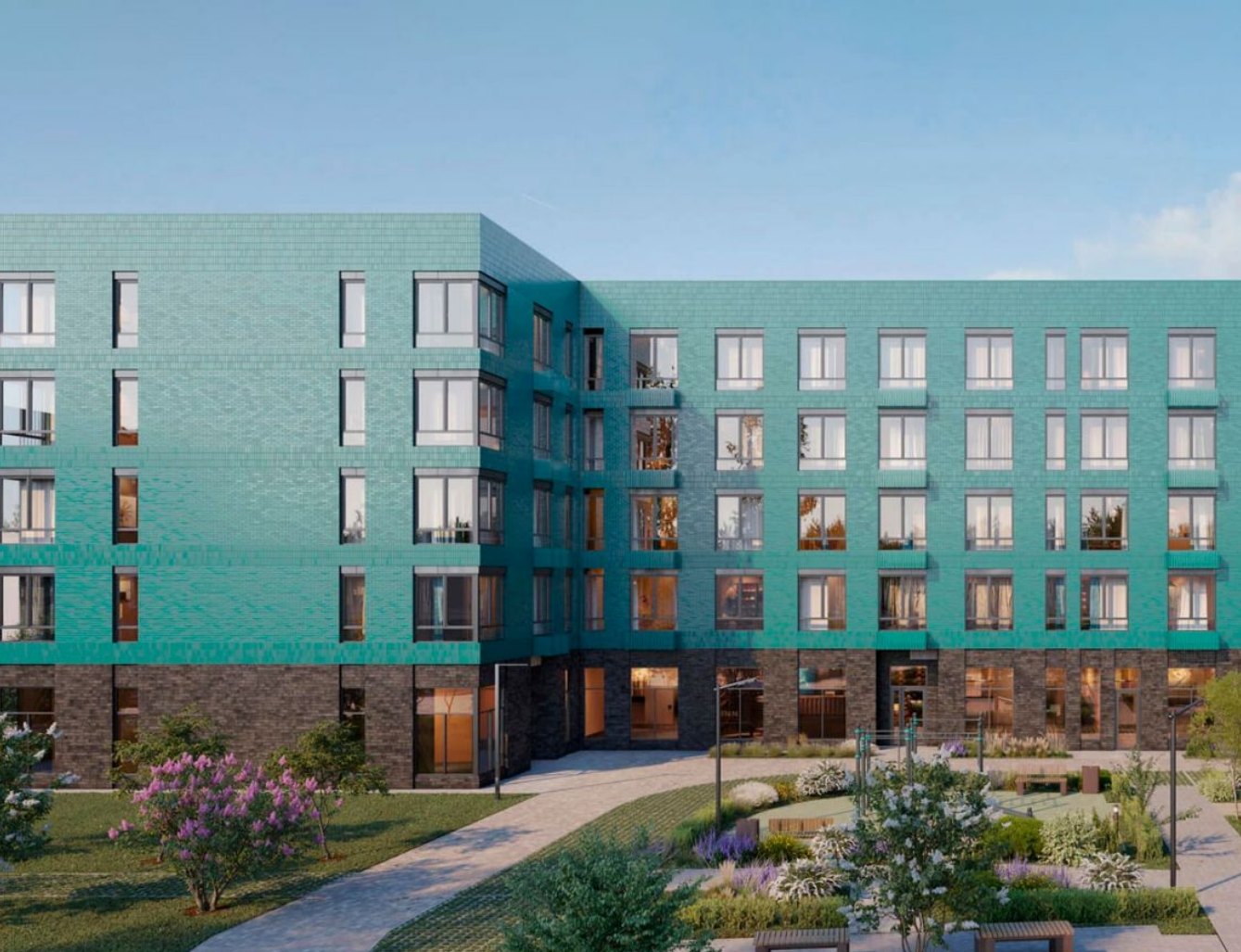
Жилой комплекс: Квартал Западный Год постройки: 2024