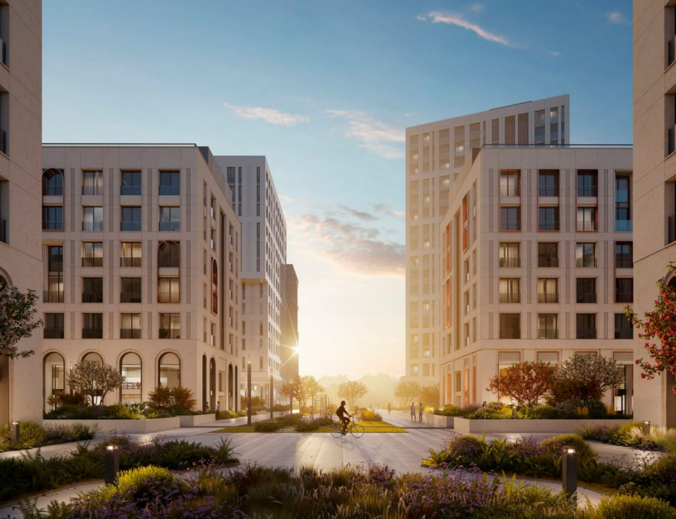
Жилой комплекс: Shagal Год постройки: 2025 Тип дома: Монолитный