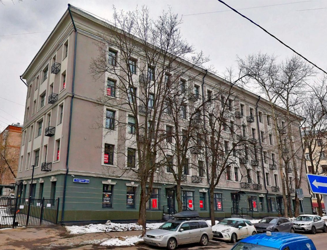
Жилой комплекс: Апарт-комплекс Парковая Лофт Год постройки: 2022 Тип дома: Кирпичный