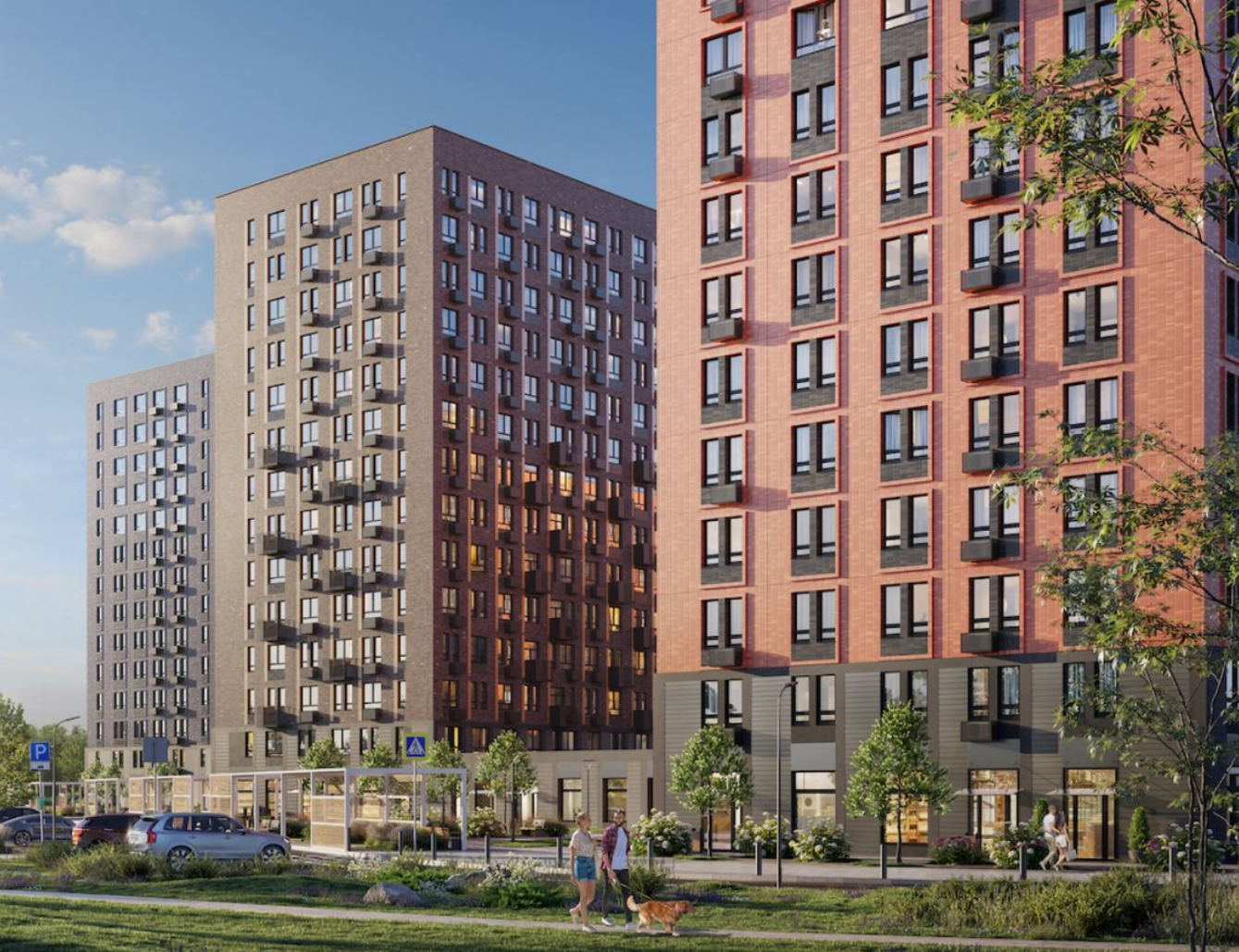
Жилой комплекс: Остафьево Год постройки: 2024 Тип дома: Панельный