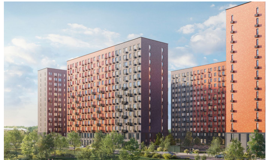
Корпус ЖК: Корпус 18 Квартал сдачи: 3