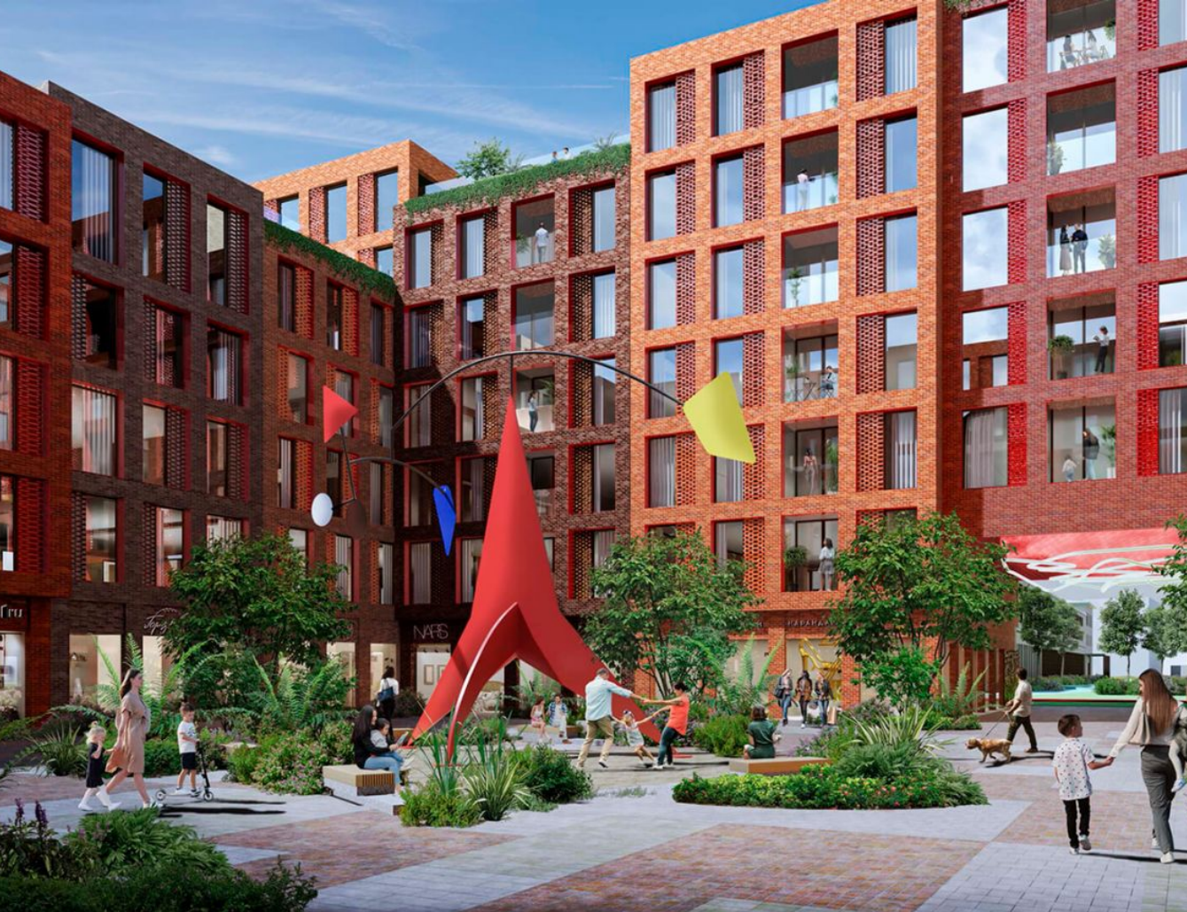
Жилой комплекс: Soul Год постройки: 2025 Тип дома: Монолитный