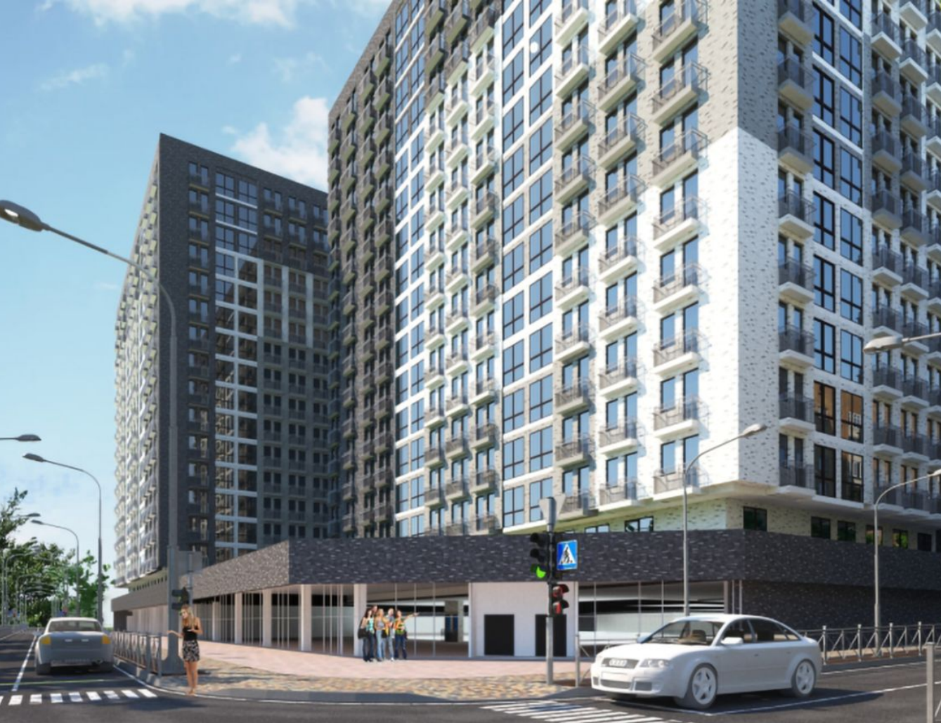
Жилой комплекс: Liberty Год постройки: 2024