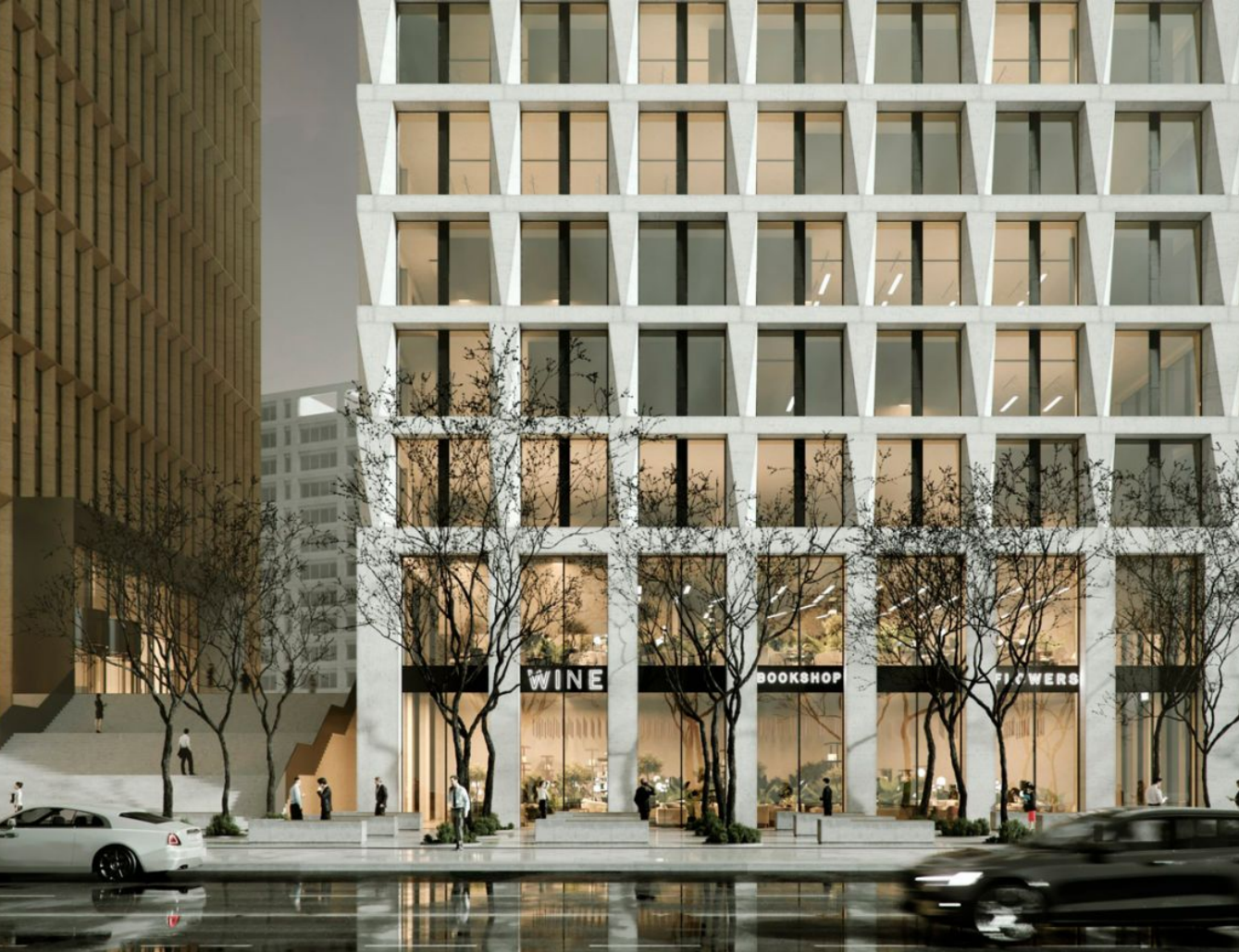
Жилой комплекс: Бизнес-центр STONE Towers Год постройки: 2025 Тип дома: Монолитный