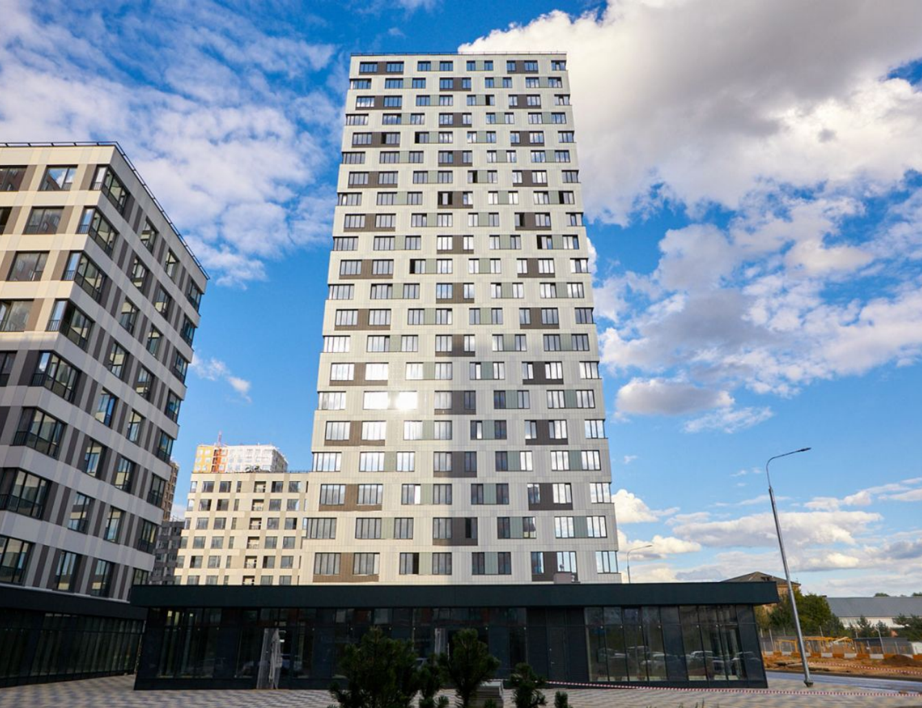
Жилой комплекс: Кварталы 21/19 Год постройки: 2023