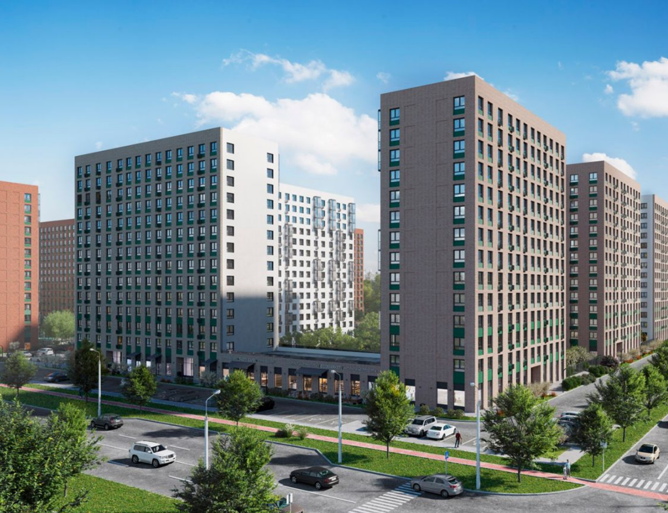
Жилой комплекс: Новое Внуково Год постройки: 2024