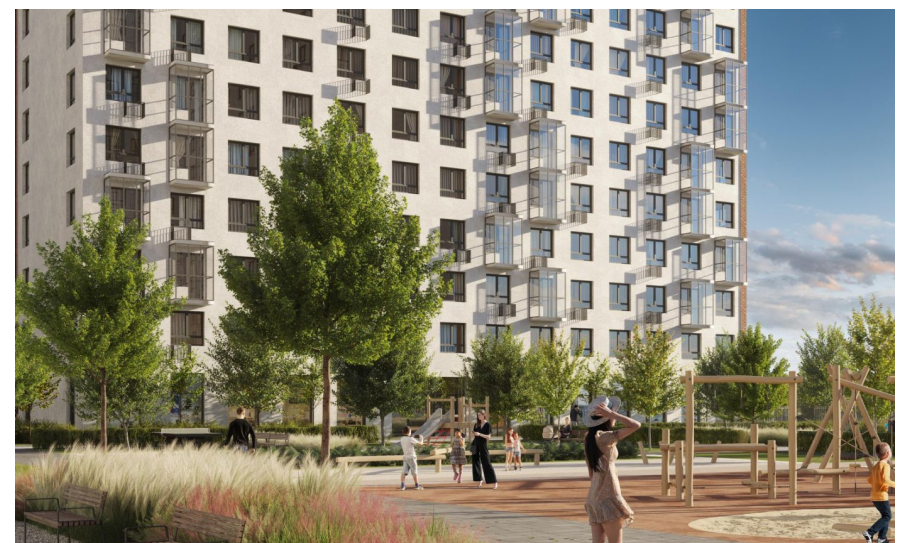
Корпус ЖК: Корпус 17 Квартал сдачи: 4