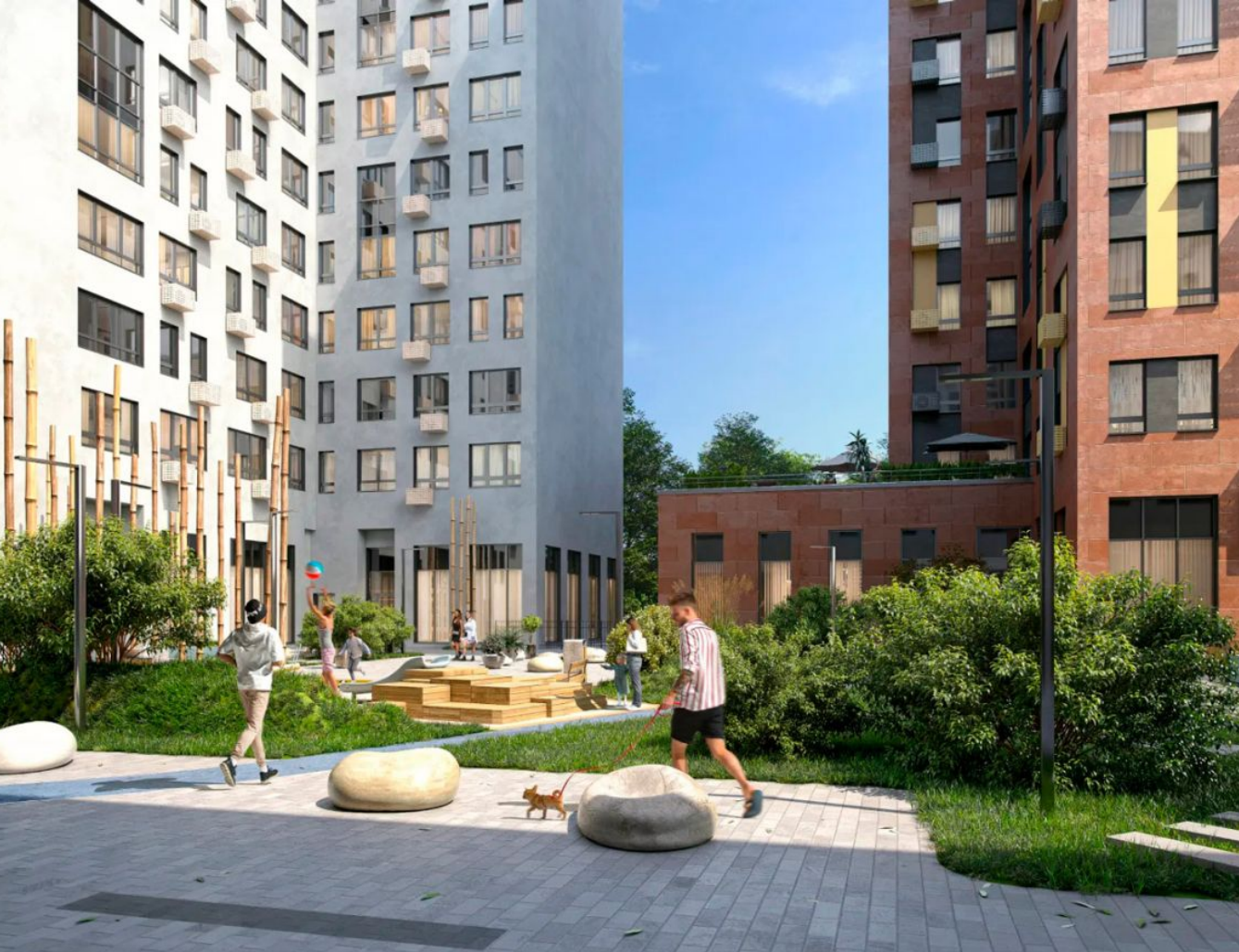
Жилой комплекс: Дзен-кварталы Год постройки: 2024