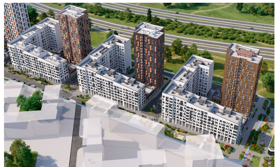
Корпус ЖК: Корпус 1.2 Квартал сдачи: 4