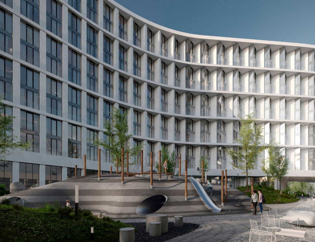
Жилой комплекс: Opus Год постройки: 2025 Тип дома: Монолитный