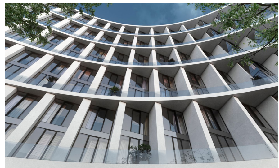
Корпус ЖК: Корпус 1 Квартал сдачи: 4