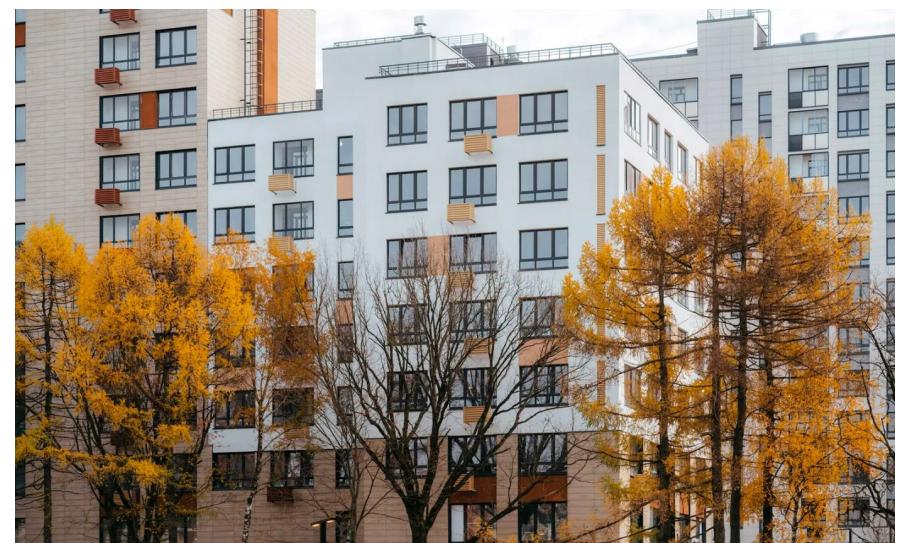
Корпус ЖК: Корпус 36.1.2 Квартал сдачи: 4