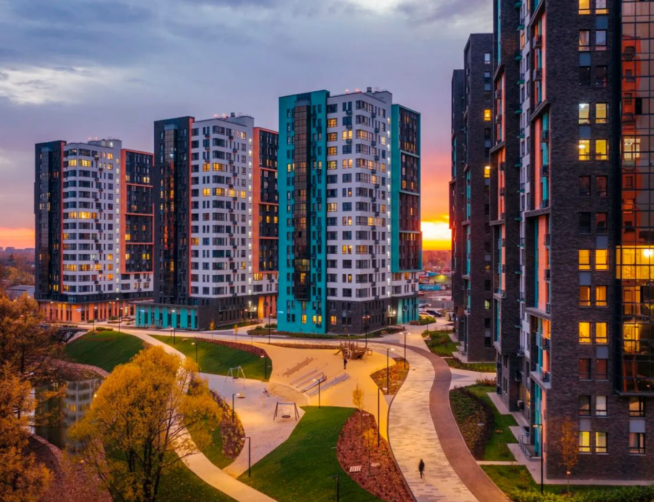
Жилой комплекс: Скандинавия Год постройки: 2024