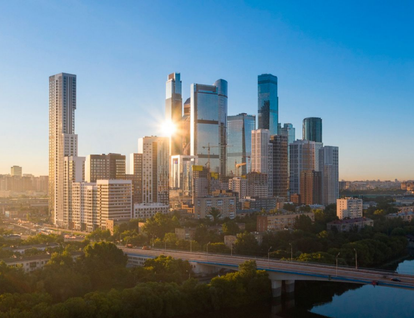
Жилой комплекс: HEADLINER Год постройки: 2024