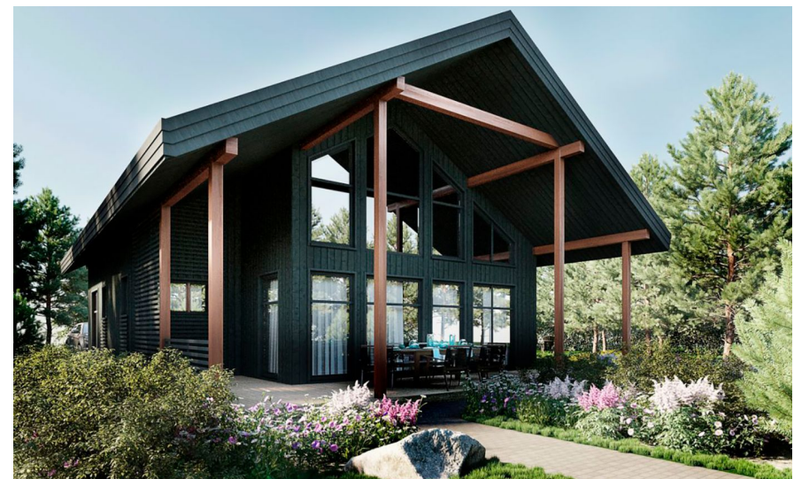
Корпус ЖК: Корпус 45 Квартал сдачи: 2