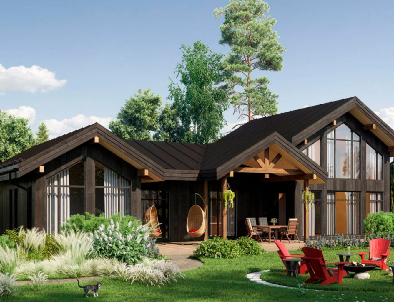
Жилой комплекс: Коттеджный поселок «Art House» Год постройки: 2023