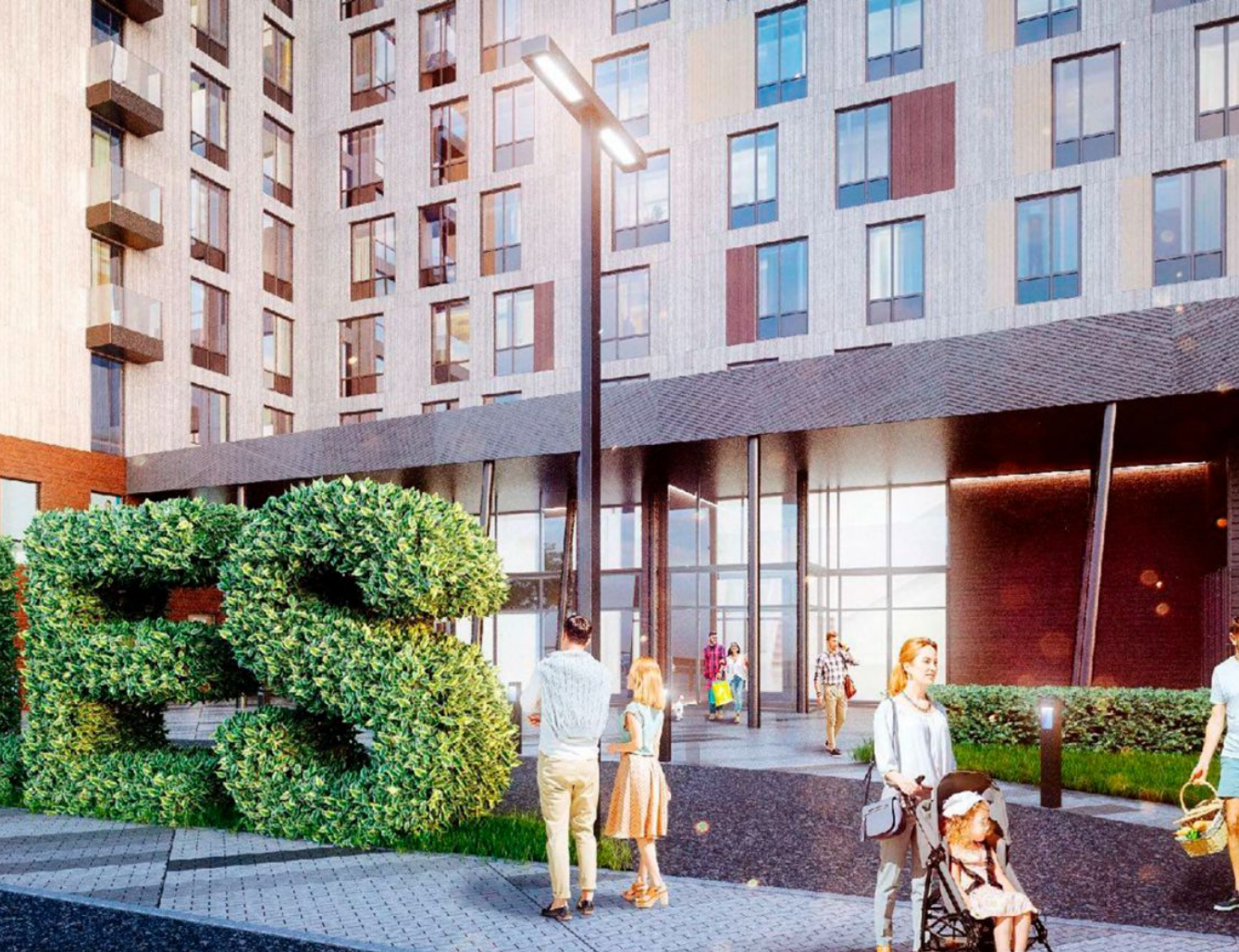
Жилой комплекс: LES Год постройки: 2023