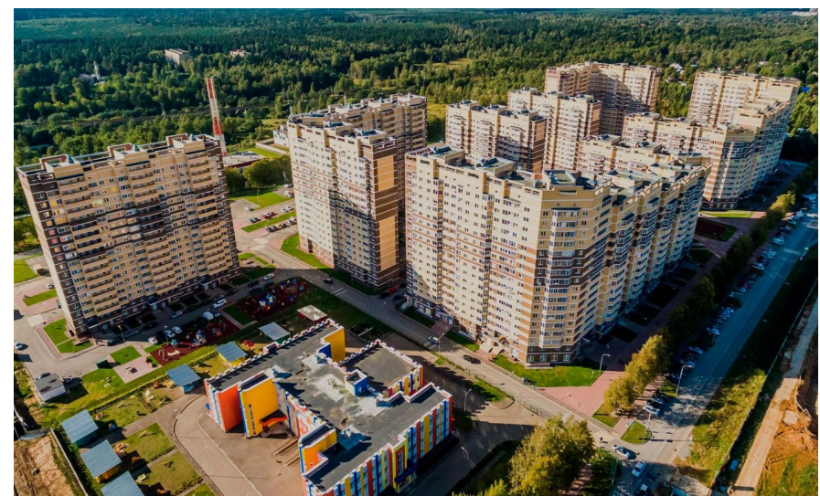
Корпус ЖК: Корпус 28 Квартал сдачи: 3