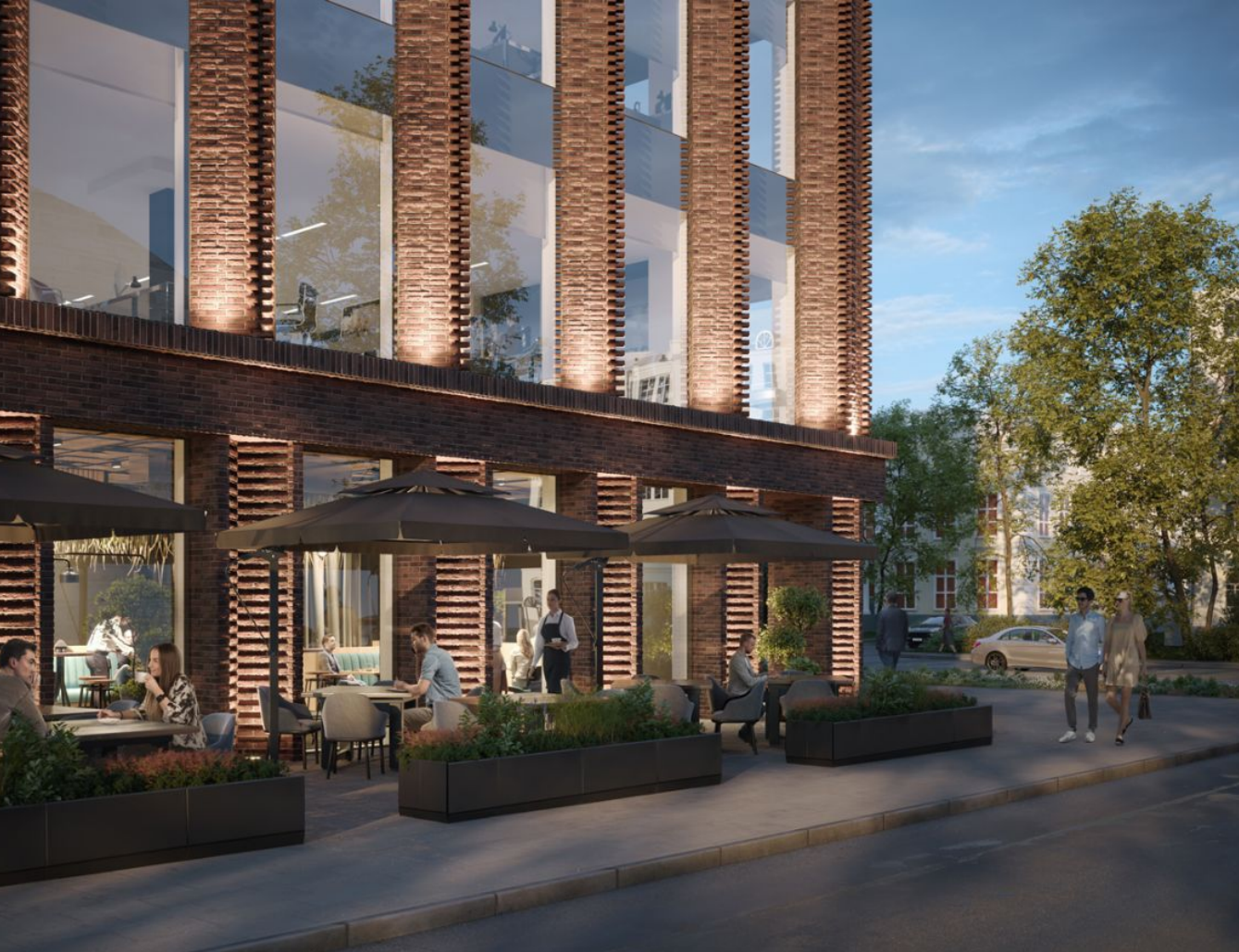
Жилой комплекс: Бизнес-центр TALLER Год постройки: 2024 Тип дома: Монолитный