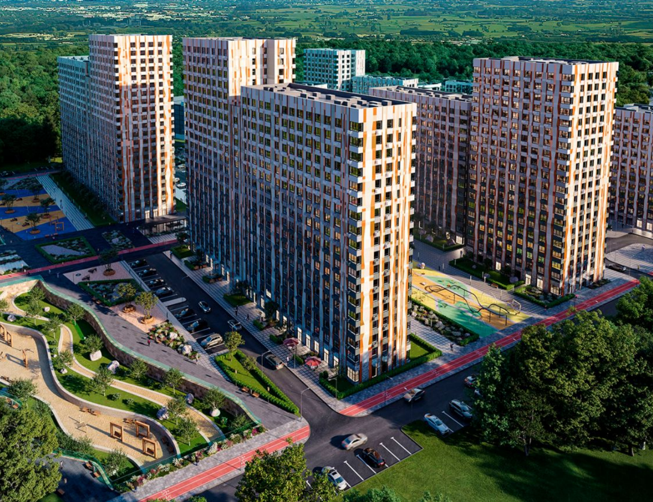
Жилой комплекс: Цветочные Поляны Год постройки: 2024