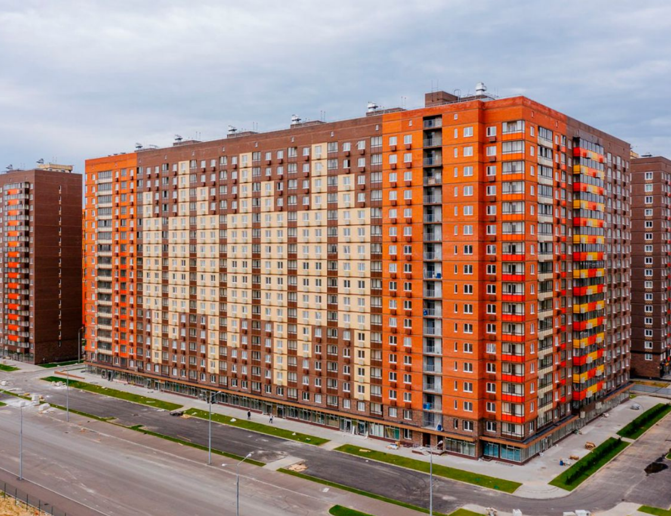
Жилой комплекс: Томино Парк Год постройки: 2023