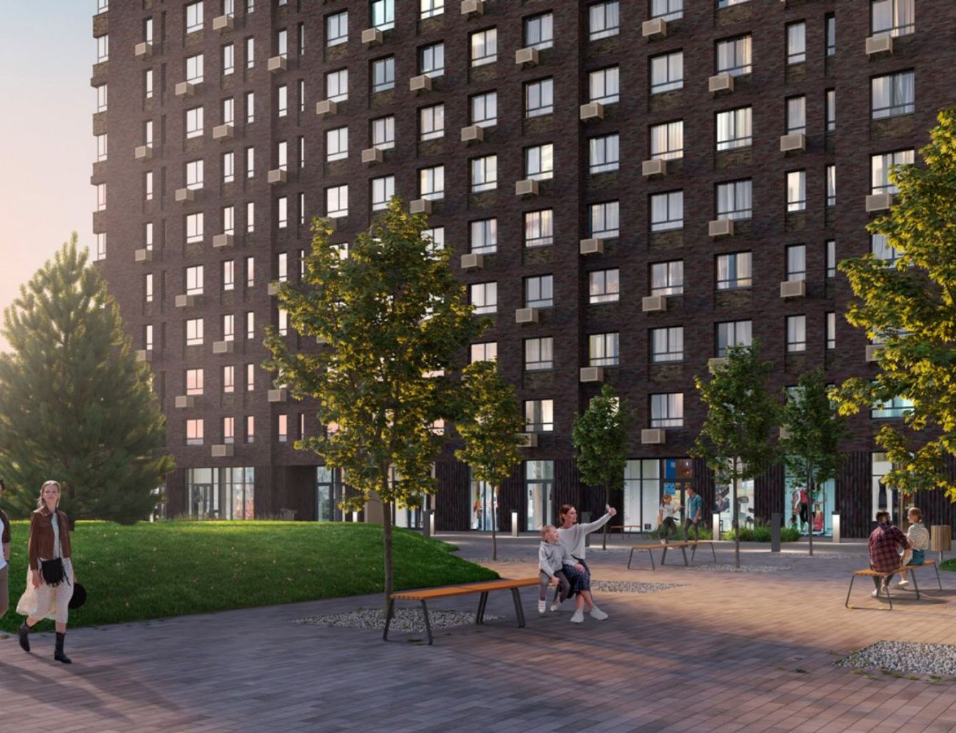
Жилой комплекс: Тропарево Парк Год постройки: 2025