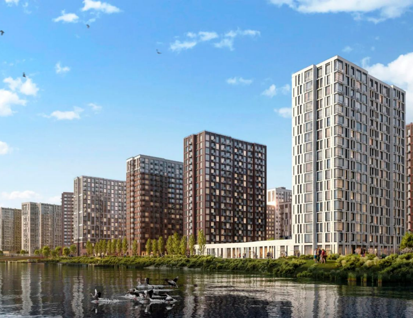
Жилой комплекс: Прокшино Год постройки: 2024