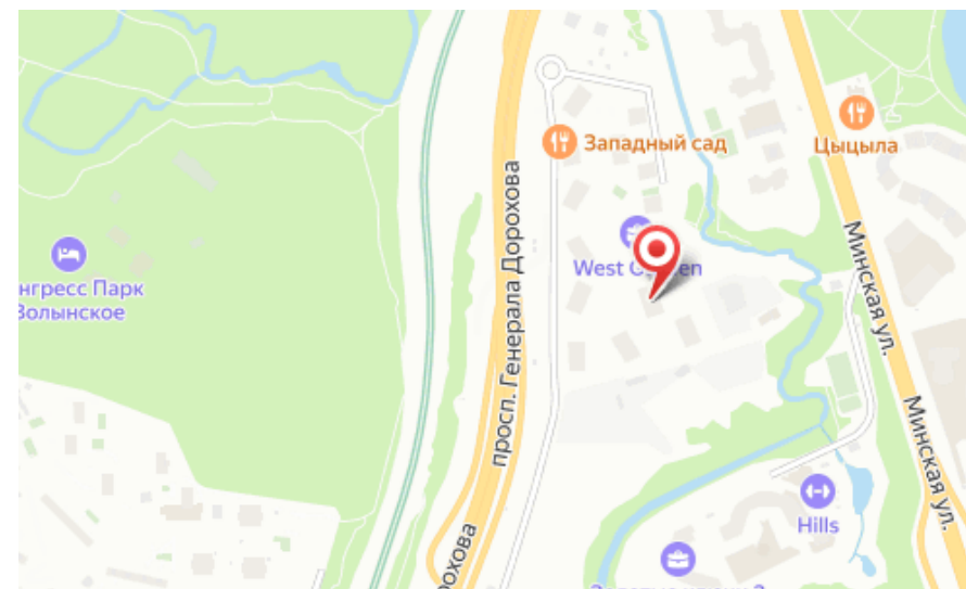
Корпус ЖК: Корпус 12 Квартал сдачи: 2