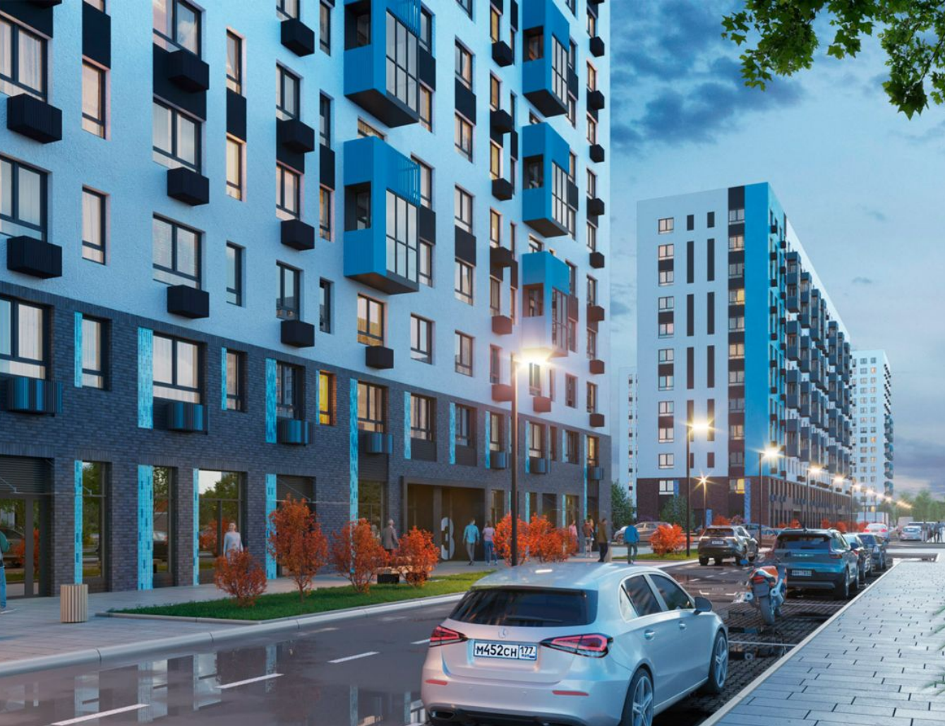
Жилой комплекс: Прибрежный Парк Год постройки: 2023