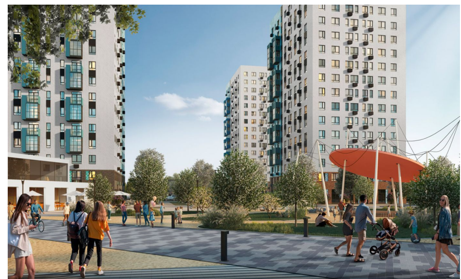
Корпус ЖК: Корпус 4.1 Квартал сдачи: 4