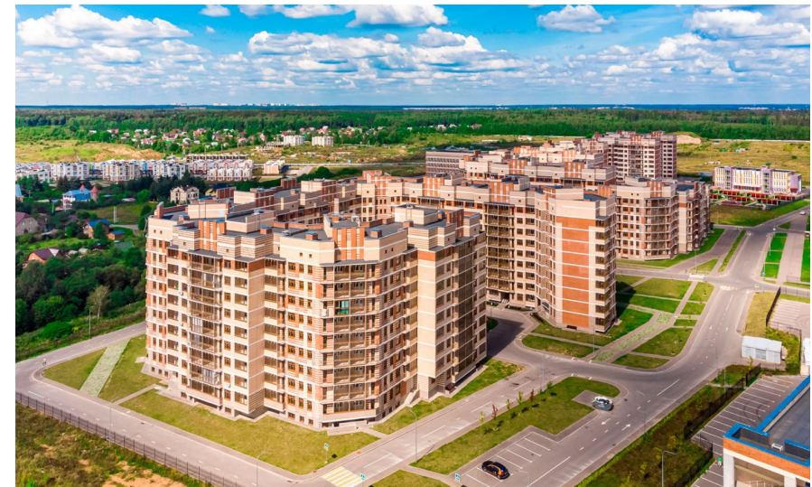
Корпус ЖК: Корпус 6 Квартал сдачи: 4