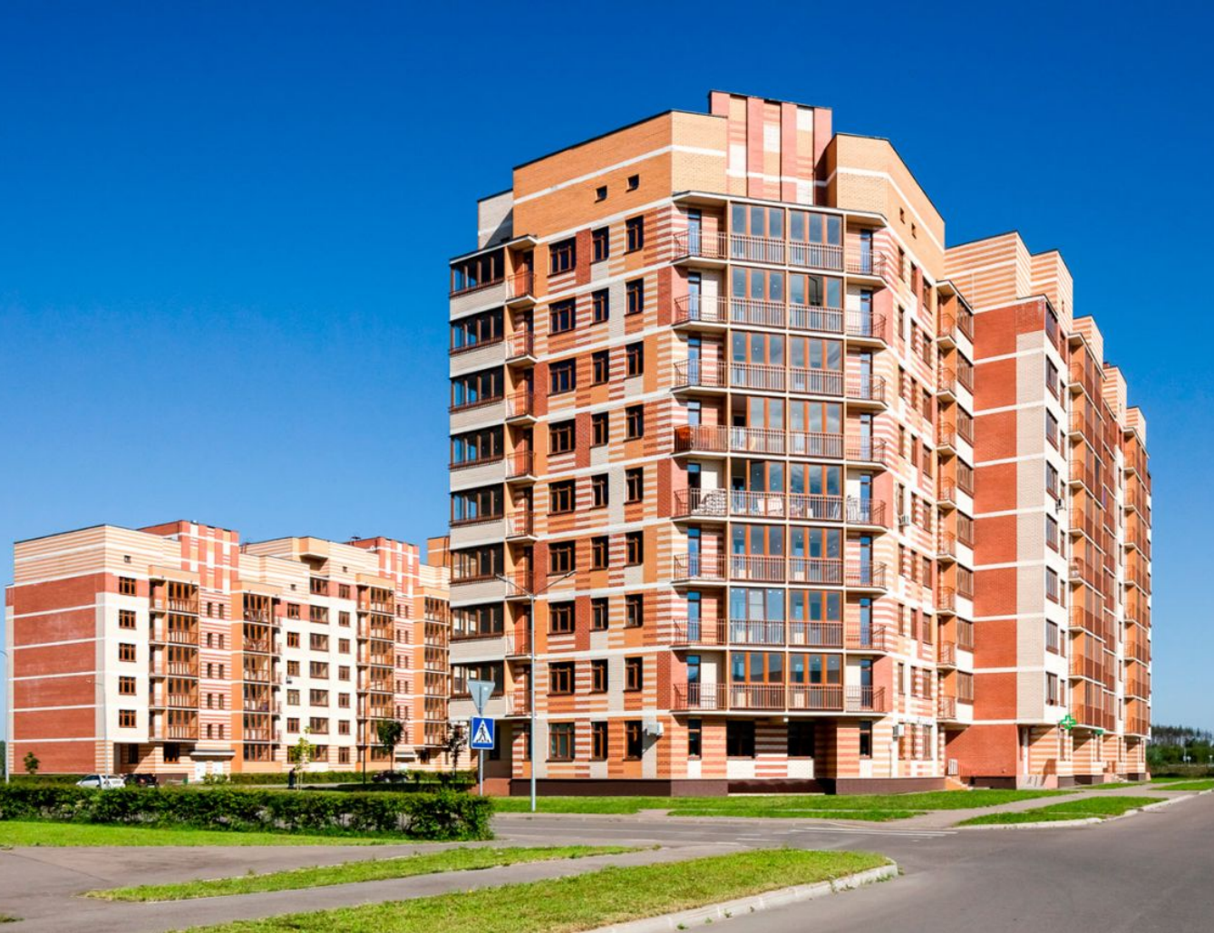
Жилой комплекс: Ново-Никольское Год постройки: 2018