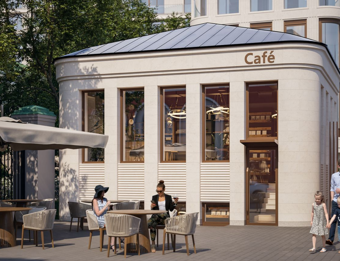
Жилой комплекс: Лаврушинский Год постройки: 2024