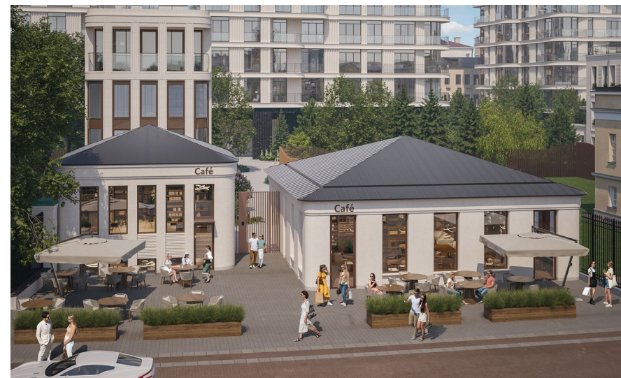
Корпус ЖК: Корпус Восточный Квартал сдачи: 2