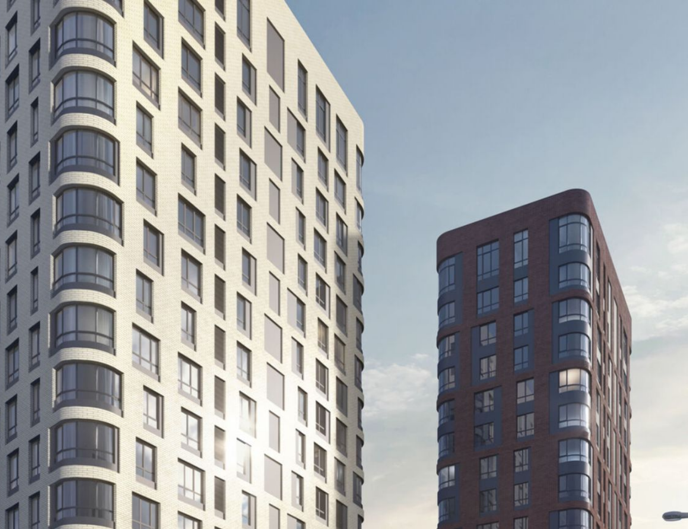
Жилой комплекс: Monodom Family Год постройки: 2023