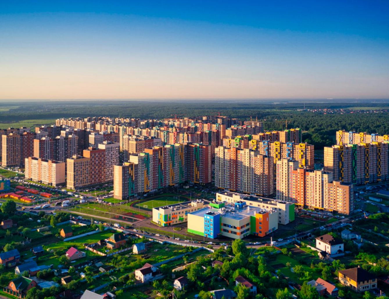
Жилой комплекс: Пригород Лесное Год постройки: 2021