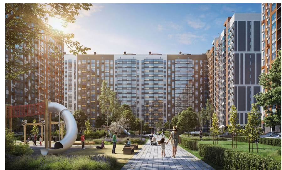
Корпус ЖК: Корпус 10 Квартал сдачи: 3