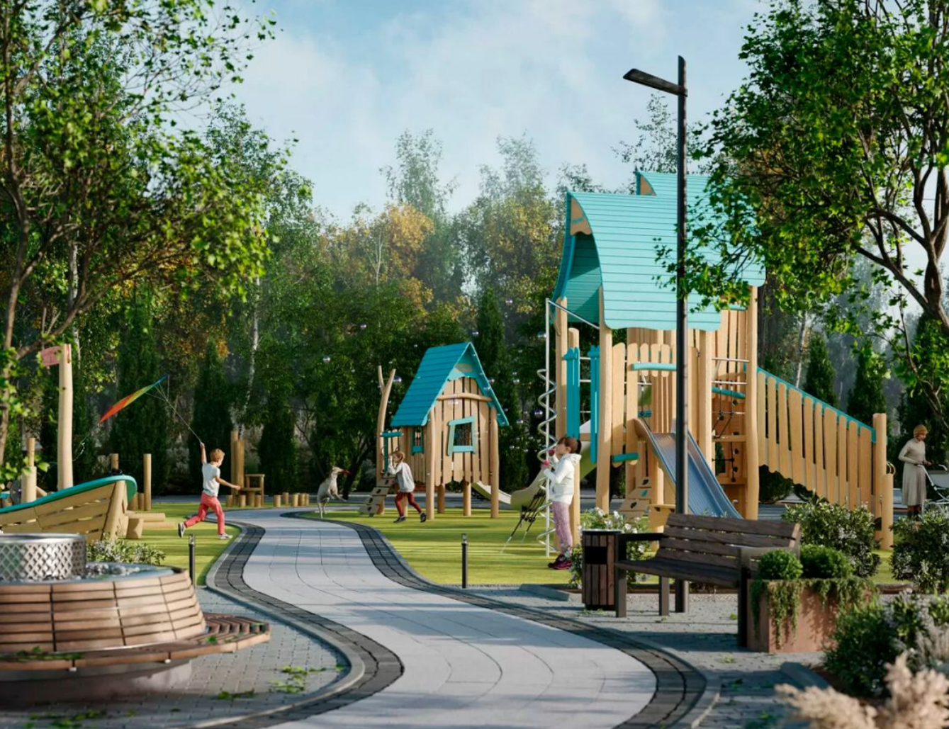
Жилой комплекс: Коттеджный поселок «SOVA» Год постройки: 2024