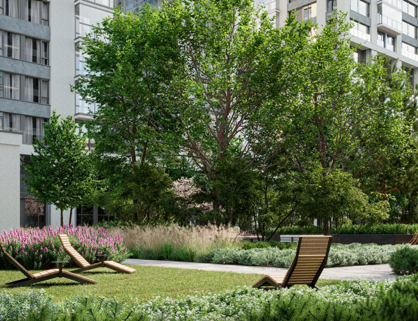
Жилой комплекс: Квартал Издание Год постройки: 2027