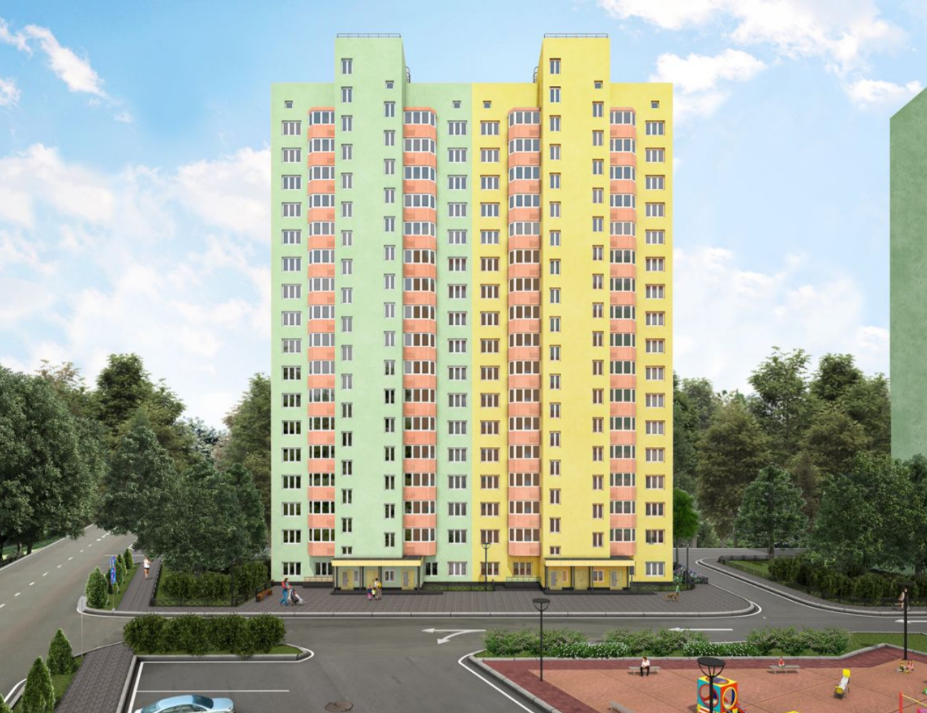
Жилой комплекс: Новые Островцы Год постройки: 2023