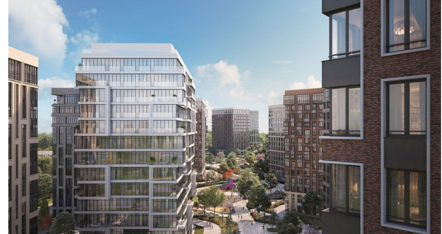
Корпус ЖК: Корпус 3 Квартал сдачи: 1