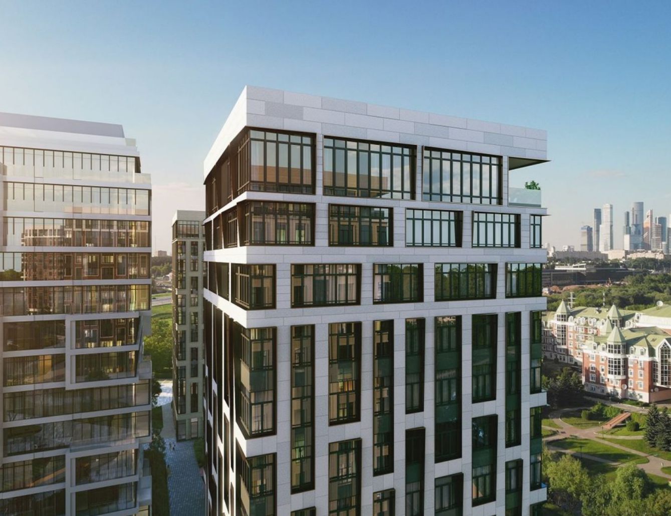
Жилой комплекс: West Garden Год постройки: 2022