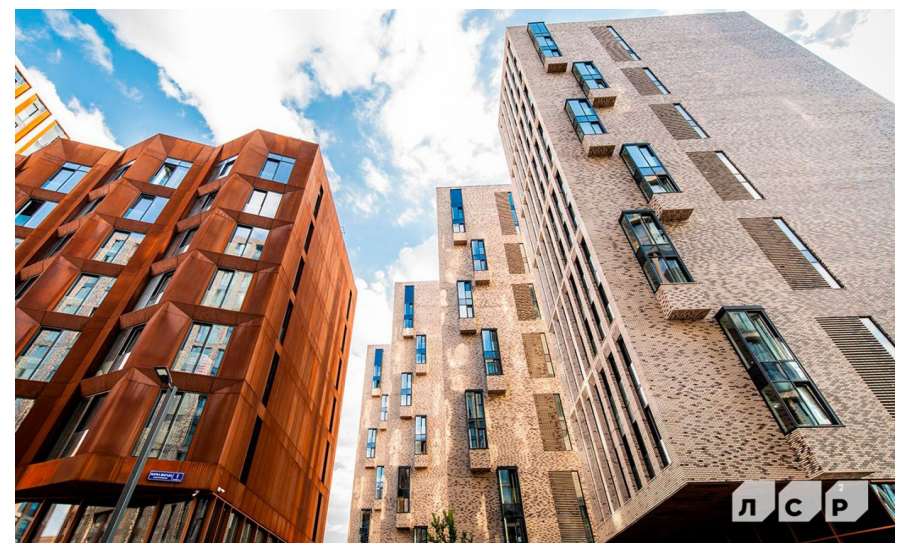
Корпус ЖК: Корпус 12.4 Квартал сдачи: 4