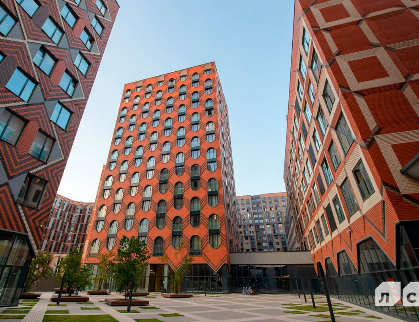
Жилой комплекс: ЗилАрт Год постройки: 2023 Тип дома: Монолитный