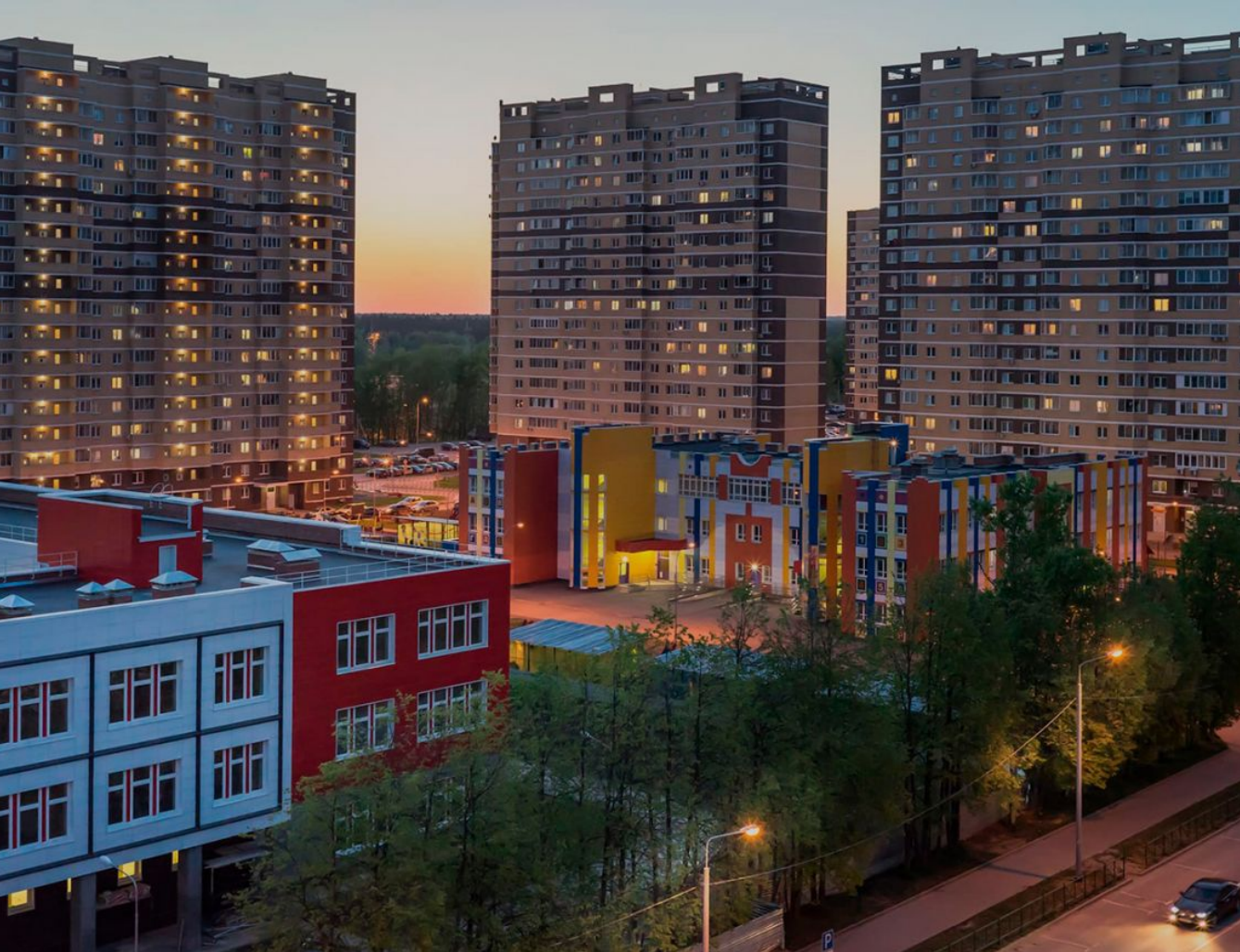
Жилой комплекс: Новое Пушкино Год постройки: 2023