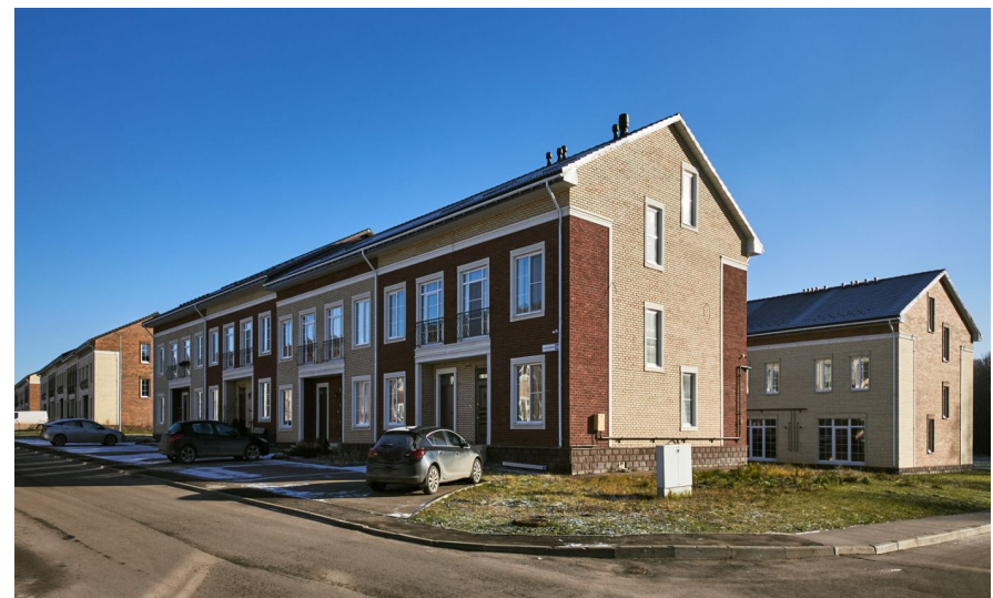
Корпус ЖК: Корпус 43 Квартал сдачи: 4