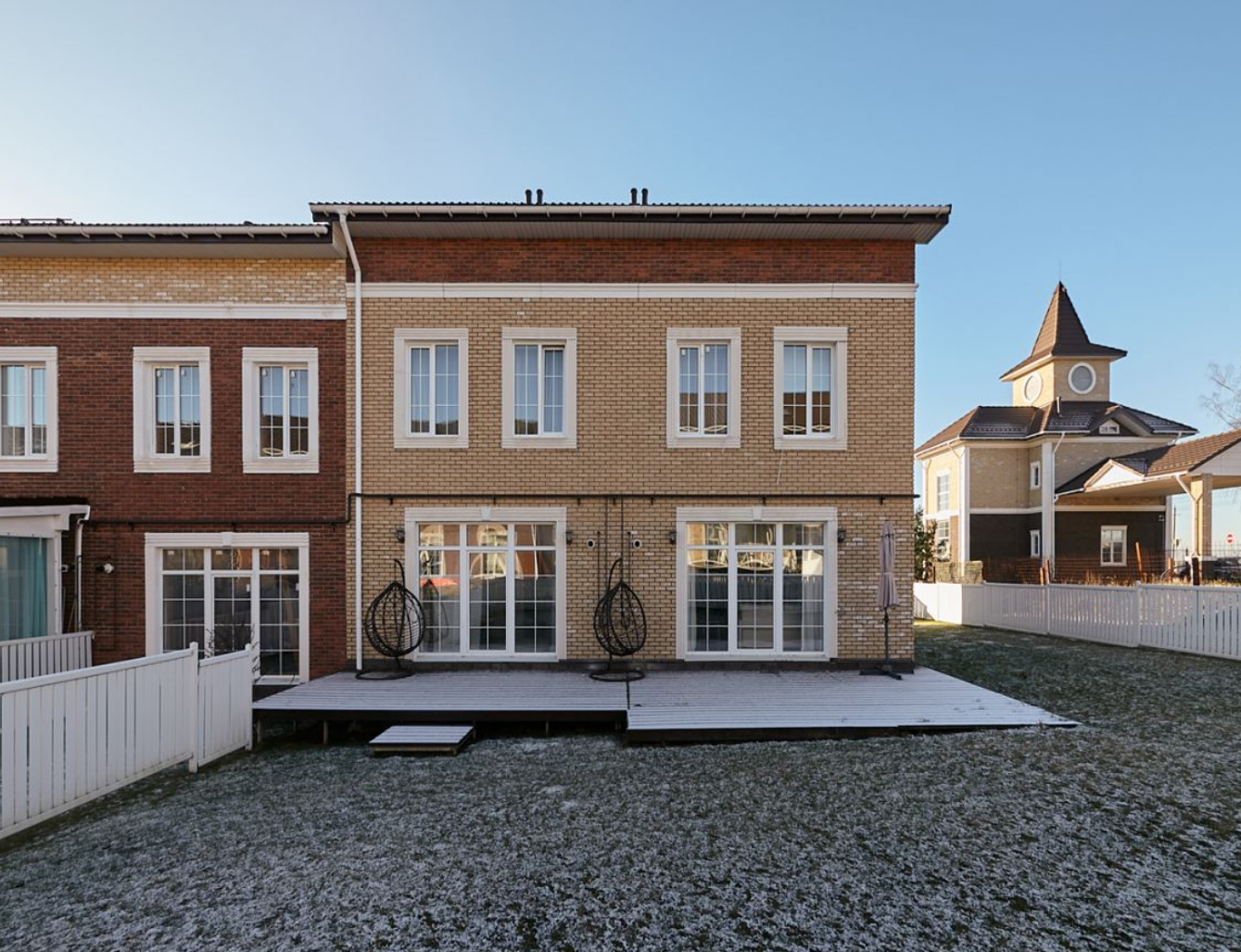
Жилой комплекс: Александрия Таун Год постройки: 2021 Тип дома: Кирпичный