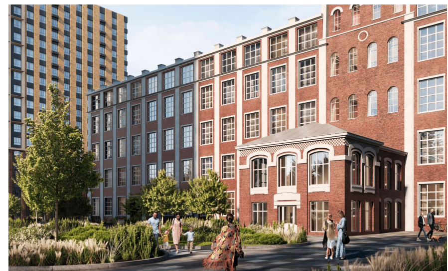
Корпус ЖК: Корпус 4 Квартал сдачи: 1