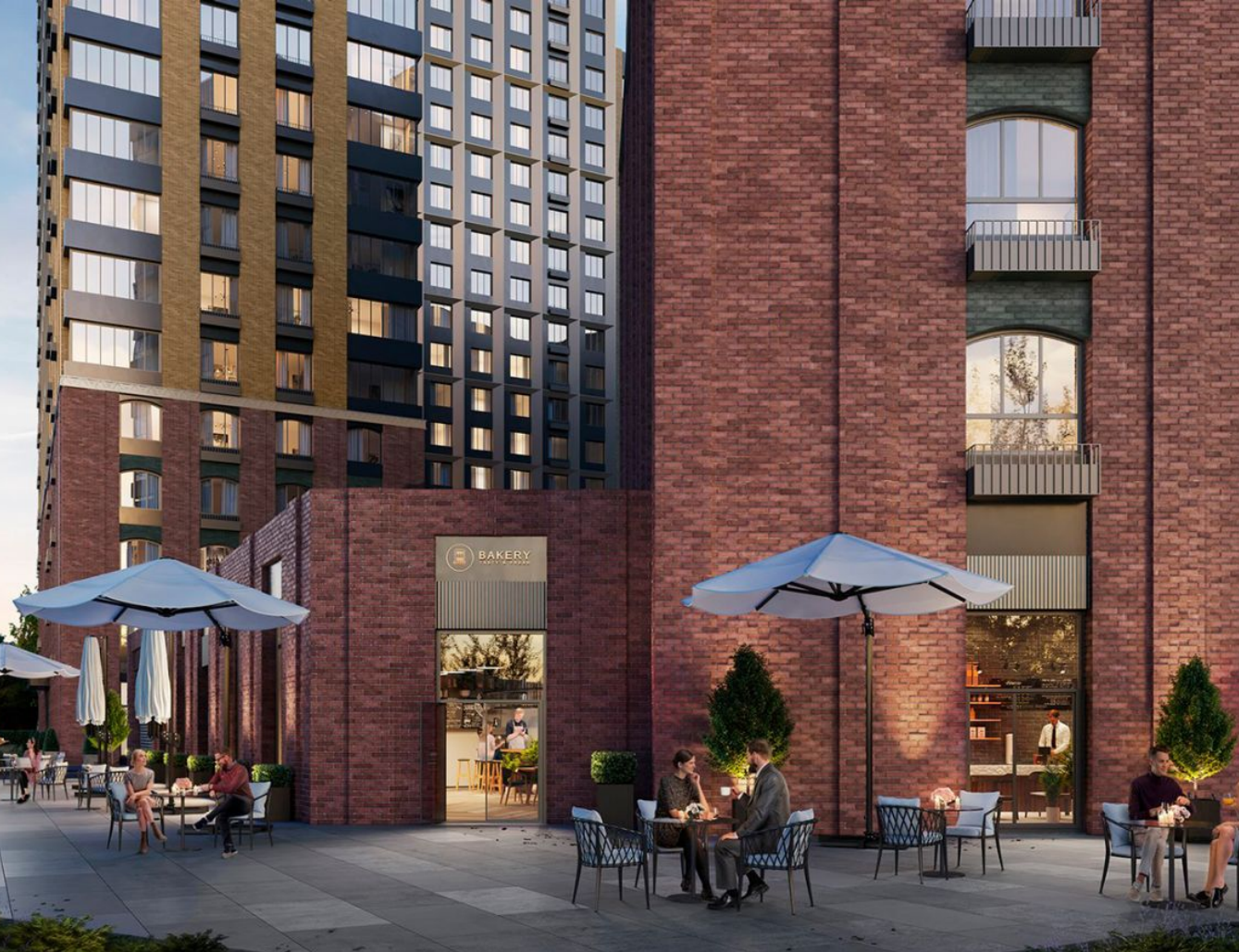
Жилой комплекс: Михалковский Год постройки: 2026