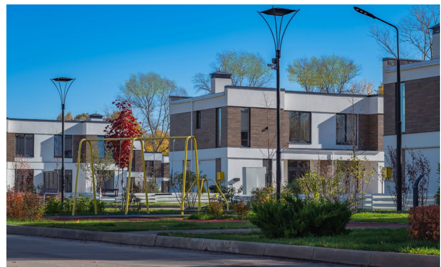
Жилой комплекс: Коттеджный поселок «Первый Пионерский» Корпус ЖК: Корпус 3-32 Год постройки: 2023 Квартал сдачи: 4 Тип дома: Кирпичный