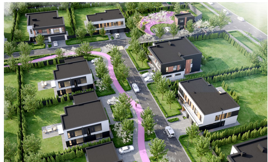
Корпус ЖК: Корпус 6 Квартал сдачи: 4