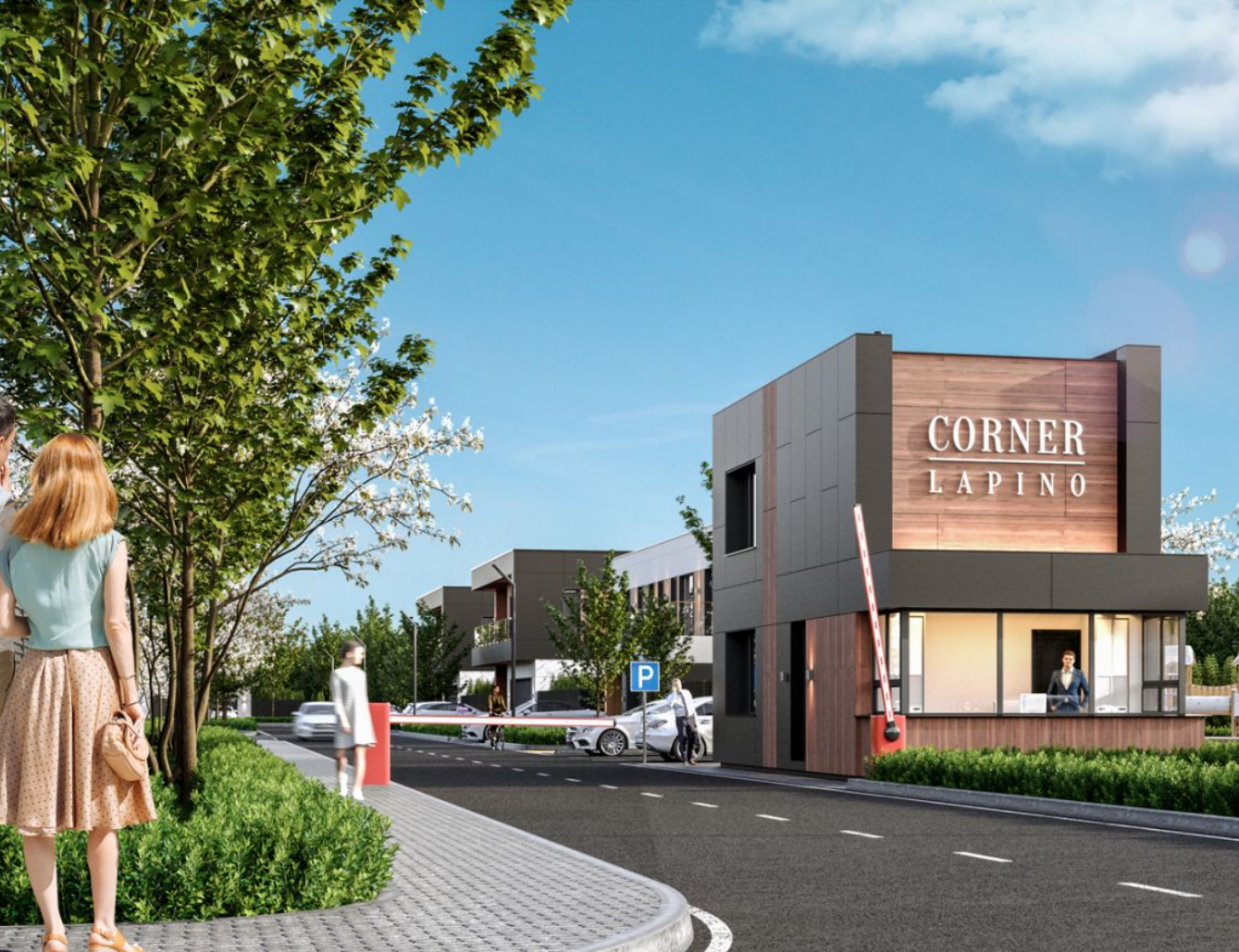
Жилой комплекс: Коттеджный поселок «Corner Lapino» Год постройки: 2023 Тип дома: Монолитный