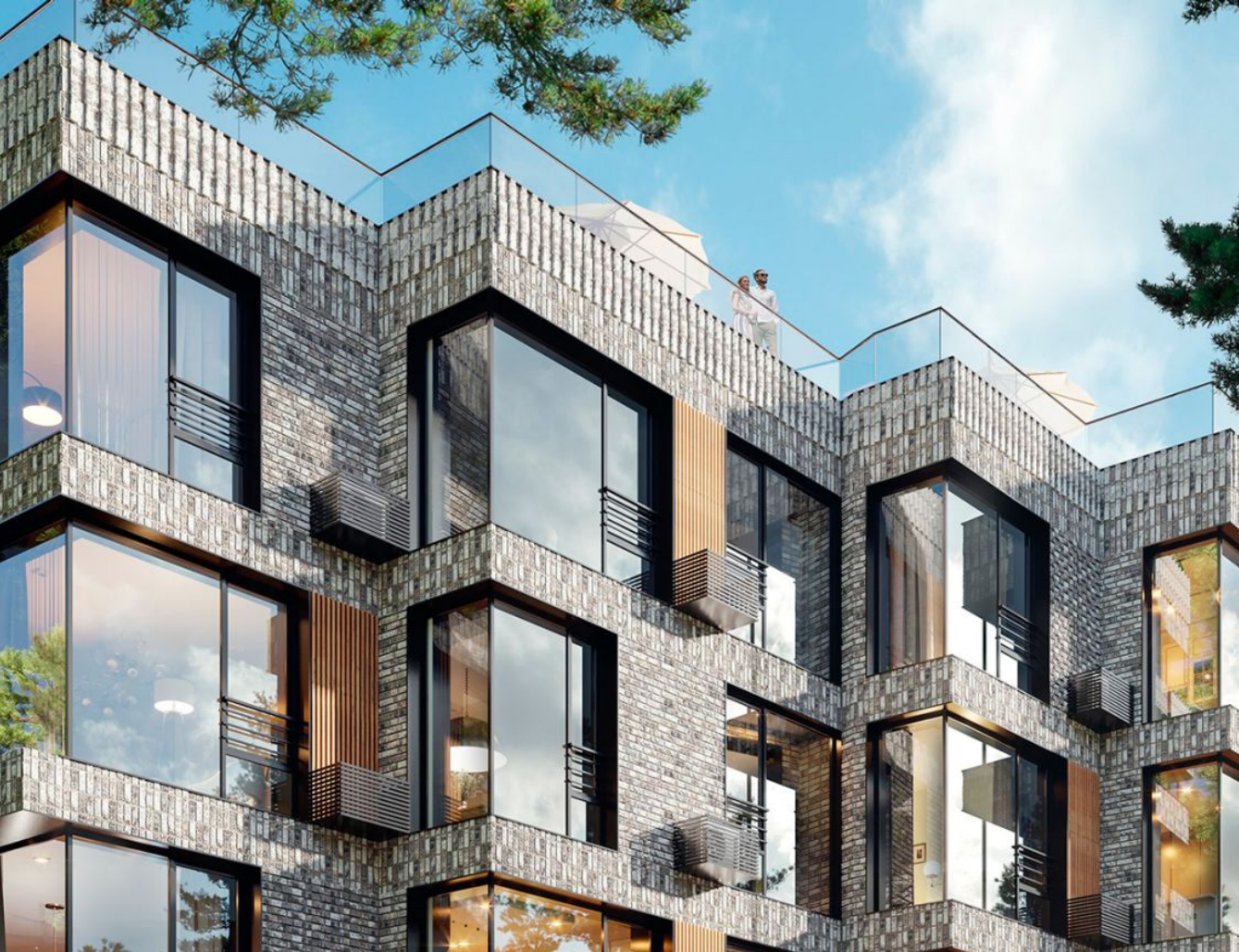
Жилой комплекс: Точка отсчета Год постройки: 2023