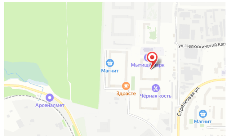
Корпус ЖК: Корпус 2 Квартал сдачи: 2