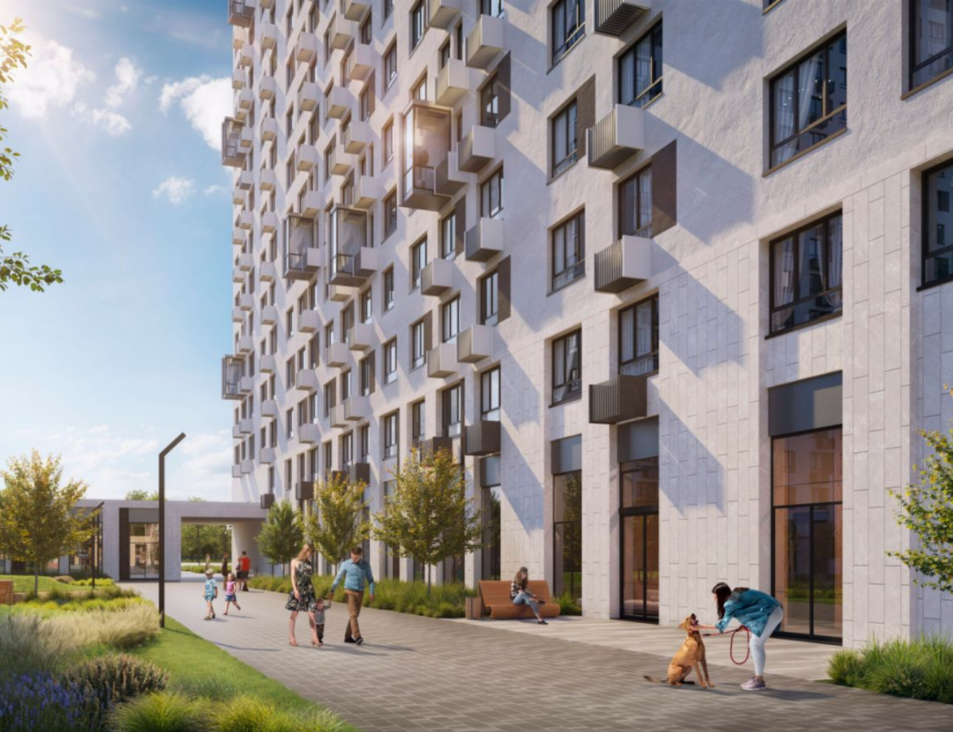
Жилой комплекс: Мытищи Парк Год постройки: 2023